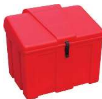
JBS110P-CORE WITH TOGGLE LATCH